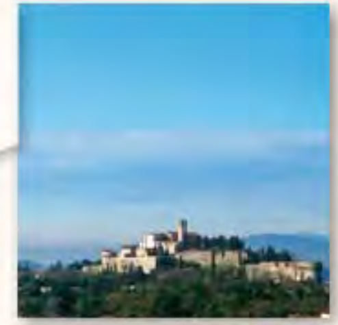
Castello Via del Castello