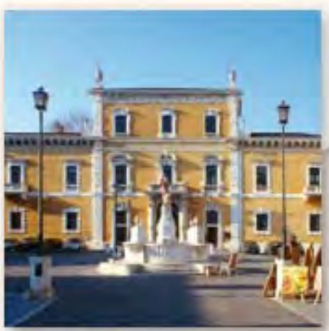
Piazza del Mercato