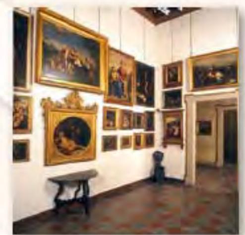
Pinacoteca Tosio Martinengo Via Martinengo da Barco, 1