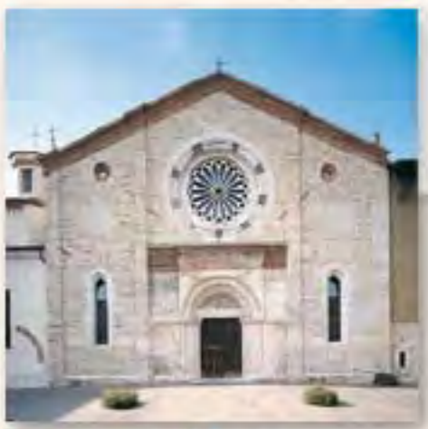
San Francesco d'Assisi Via San Francesco