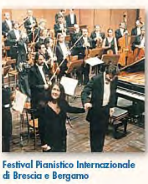
Festival Pianistico Internazionale di Brescia e Bergamo