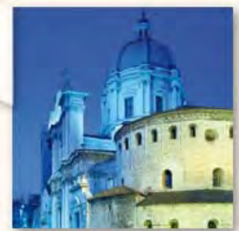
Duomo Vecchio e Duomo Nuovo Piazza Paolo VI