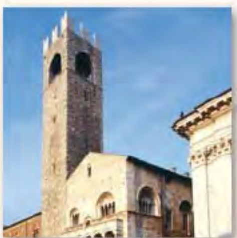
Palazzo Broletto Piazza Paolo VI