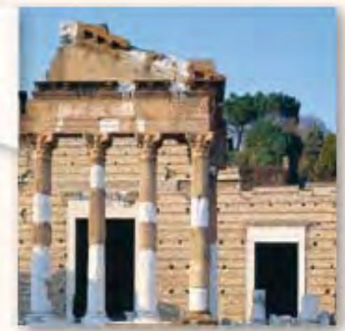
Tempio Capitolino Via Musei, 57/a