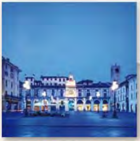
Piazza della Loggia