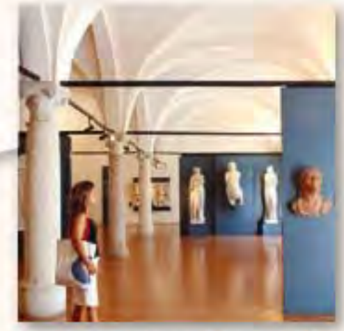
Museo di Santa Giulia Via Musei, 81/b