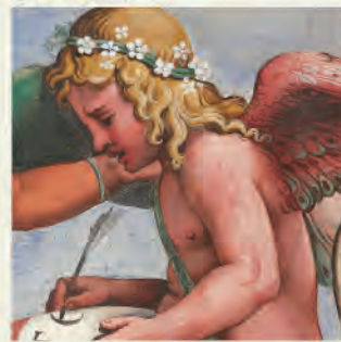
Sala di Amore e Psiche (particolare)