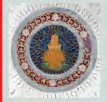
Camera del Crogiolo