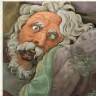
Sala dei Giganti (particolare)