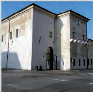
Palazzo San Sebastiano

MUSEO DELLA CITTÀ PALAZZO SAN SEBASTIANO