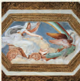
Camera dei Venti (particolare)